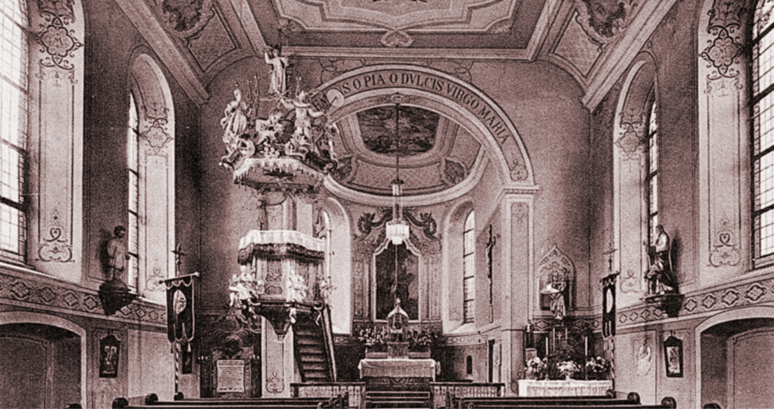
Innenaufnahme aus dem Jahre 1926

Auch wenn bei einem Kirchenbau der Architekt das Seinige tun muss, so ist doch am Ende die Kirche das, was diejenigen aus ihr machen, die sich in ihr versammeln um Gott anzubeten.