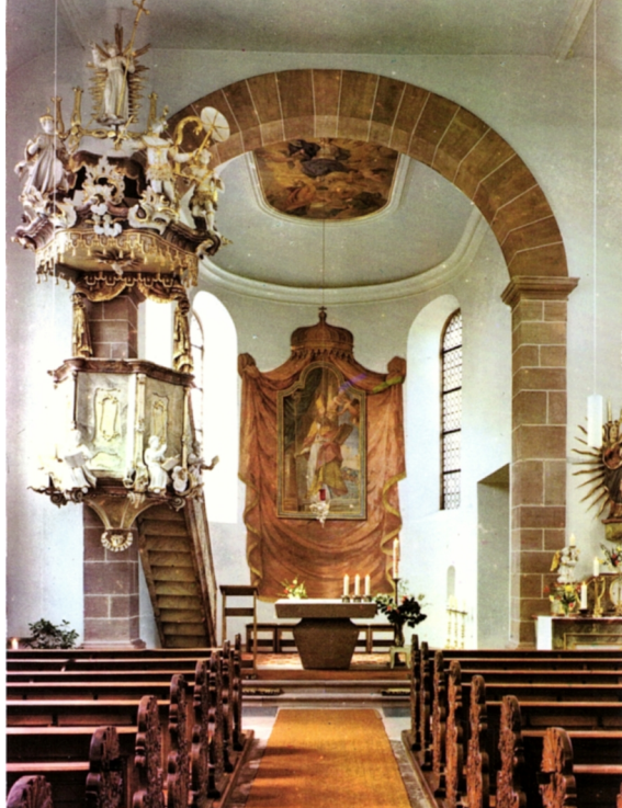
Kircheninneres nach der Renovation 1973

Der alte Hochaltar mit dem schönen Tabernakel der Fa. Marmon aus Sigmaringen wurde entfernt und durch einen neuen Altartisch aus Sandstein versus populum ersetzt, der von der Fa. Schmelzer in Rockenau aus Neckarsandstein gefertigt wurde. Die äußeren Flächen sind grob gespitzt bearbeitet, die Oberfläche geschliffen. Die Hostien werden nun im Tabernakel des rechten Seitenaltares (Abbildung links) aufbewahrt. Dieser klassizistische Altar ist bereits auf der Fotografie von 1926 (Seite 2) zu erkennen. Die barocken Leuchterengel stammen vom alten Hochaltar. Die Altarweihe erfolgte am 11. März 1973, durch Abt Albert Ohlmeyer von Stift Neuburg. Dabei wurden Reliquien der Märtyrer Urbicus und Virginia in den Altar eingelassen. Das heutige Erscheinungsbild ist durch die Renovation im Jahr 1990/91 geprägt. Aussen und innen wurde das Gotteshaus mit einem freundlichen weiß/hellgelben Anstrich versehen. Damit wird der barocke Festcharakter besser hervorgehoben. Das Turmdach wurde im Jahr 2015 saniert.